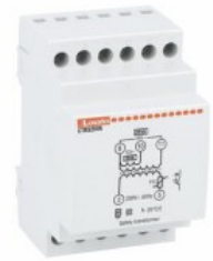
Trasformatori modulari di sicurezza CTRS AC 3